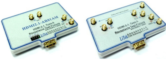
圖 1: HDMI 2.1 Type A 母座測試治具

厘科科技的 HDMI2.1-AR01AM 是一個 HDMI A 的母座測試治具。此一治具除了可以用來測試具備 HDMI A Plug 的線材外，也可以用來測試連接一條 HDMI A 的線材到 HDMI Type A 母座的裝置。在測試治具上，擁有 5 對 SMA 的高頻接頭，可以用來與示波器或訊號產生器連接。治具上的特性阻抗，經過特殊設計，可以落於 95~105 Ohms 之間，且 5 對訊號的對內時間差都被設計小於 3ps 以內。