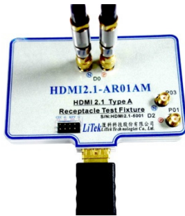
圖 2: HDMI 治具插上一條 HDMI Type A 的線材

厘科科技的 HDMI2.1-AR01AM 是一個 HDMI A 的母座測試治具。此一治具除了可以用來測試具備 HDMI A Plug 的線材外，也可以用來測試連接一條 HDMI A 的線材到 HDMI Type A 母座的裝置。在測試治具上，擁有 5 對 SMA 的高頻接頭，可以用來與示波器或訊號產生器連接。治具上的特性阻抗，經過特殊設計，可以落於 95~105 Ohms 之間，且 5 對訊號的對內時間差都被設計小於 3ps 以內。